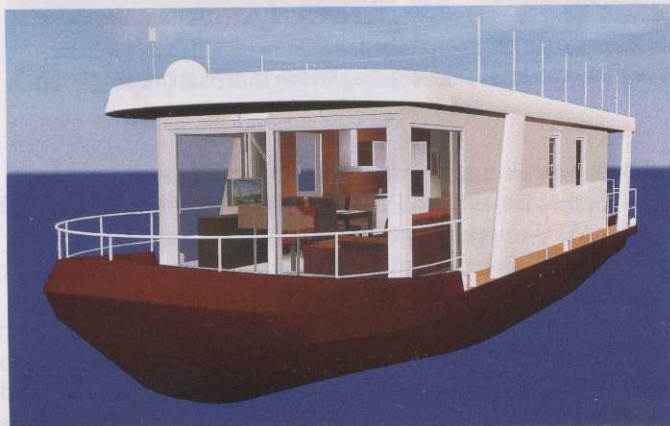
Manövrieren leicht gemacht: In den Alu-Rumpf wird ein hydraulisches Antriebssystem für Bug- und Heckschraube installiert.