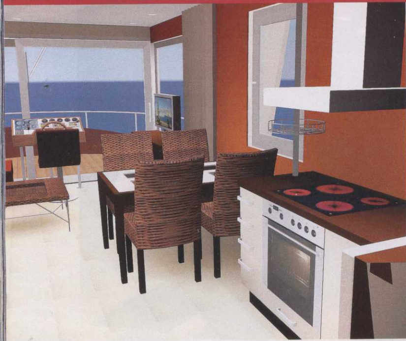
Kochen mit Blick aufs Meer: In der komplett ausgerüsteten Bordküche findet der Smut alles, was er braucht.