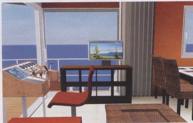
Schöne Aussichten: Wohin die Reise geht, sehen der Steuermann und seine Gäste durch die große „Terrassentür“.